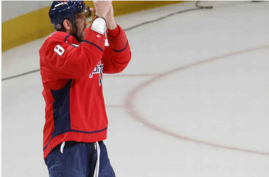
Alexander Ovechkin durante un partido de la NHL

Sin embargo, el rechazo más duro de recibir por Putin ha sido el de Alexander Ovechkin . Este jugador de los Washington Capitals nunca ha ocultado su respaldo al presidente ruso. De hecho, con la guerra de Crimea mostró su absoluto respaldo a Vladimir Putin. Una postura que hoy no ha podido defender y que le han llevado a oponerse, aunque con la boca pequeña, a lo sucedido en Ucrania.