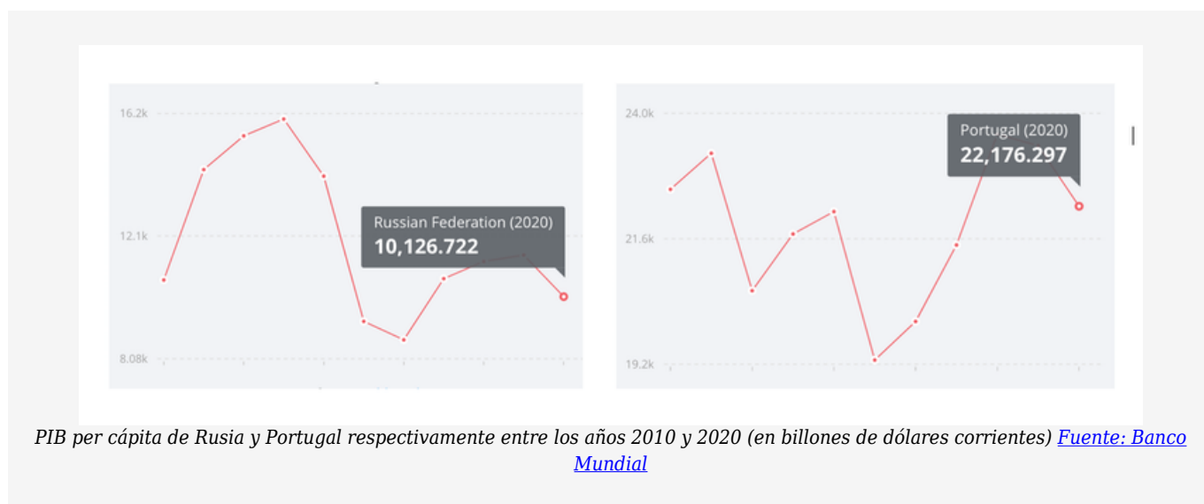
PIB per cápita de Rusia y Portugal respectivamente entre los años 2010 y 2020 (en billones de dólares corrientes)

¿Cómo proyectar entonces la imagen de potencia mundial que Putin quería para Rusia? El deporte sería el escaparate perfecto.