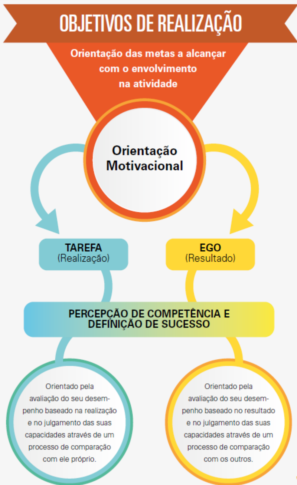
Figura 1 - Esquemática da Teoria das Metas de Realização

Os primeiros esforços para compreender e identificar a estrutura situacional dos objetivos subjacentes à teoria das metas de realização ocorreram no âmbito da educação, mais concretamente no clima motivacional da sala de aula, embora as primeiras ligações da temática com o contexto da educação física e do esporte tenham surgido logo na sequência. Nesta ocasião foram identificadas diferenças teóricas entre o que se designou de clima motivacional para maestria (orientação