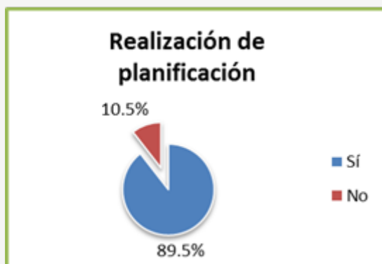
Figura 2. Porcentaje de gerentes/directivos que realizan anualmente la planificación del club

Si se considera el valor del porcentaje del 32,1% de los gerentes que NO realizan ningún diagnóstico de su entorno (Figura 1), y se le resta el 10,5% de los que no realizan planificación en su club, destaca el valor de la diferencia del porcentaje, donde el 22% de gerentes que dice que planifica no realiza ningún tipo de diagnóstico del entorno previo. Teniendo en cuenta este dato, difícilmente este 22% de gerentes pueden realizar una planificación fiable sin un diagnóstico previo, y por tanto sería complicado que pudiese cumplir con su responsabilidad y con una de las funciones básicas de cualquier gestor deportivo (Mestre, 2004; París, 2007).